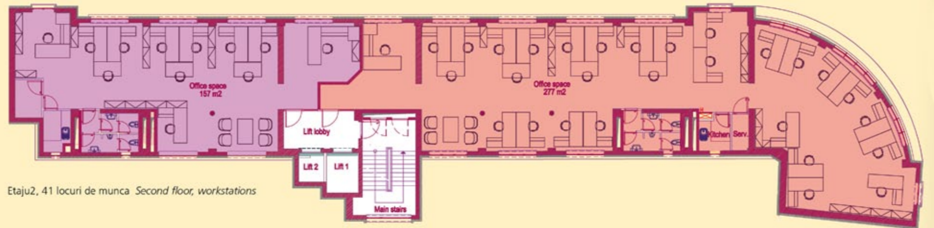
Etajul 2, 41 locuri de munca Second floor, workstations

The winding form of the building is continued in the interior and symbolizes movement and progress. The spaces are equipped with full ventilation systems, modern heating and cooling systems by means of a four-pipe fan-coil system. The entrances are secured by access systems. All rooms are equipped with cable ducting for data and telecommunications. Two elevators will carry the clients and employees rapidly to all levels. An excellent internal communication system and an electronic fire protection system ensure that daily business in offices and shops runs smoothly.