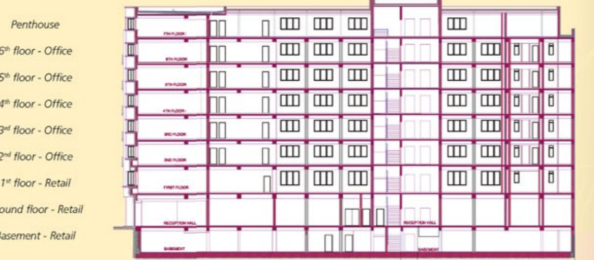
Ground floor - Retail